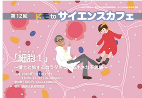
写真 2. コドモ to サイエンスカフェ第 12 回のフライヤー

本稿で取り上げる「コドモ to サイエンスカフェ」について概説する。コドモ to サイエンスカフェは、2011 年度に筆者の坂倉らが立ち上げた学生団体「コネット（子どもと科学を結ぶプロジェクト）」（2010～2011 年度）が「大人も子どもも一緒に楽しめるサイエンスイベントをしたい」という思いから子どもゆめ基金助成事業の助成を得て始めた取組みである。2012 年度以降は主催を CLCworks (2) に移しながらも年間 2～3 回のペースで開催をし、2015 年 9 月現在第 14 回目を迎える。