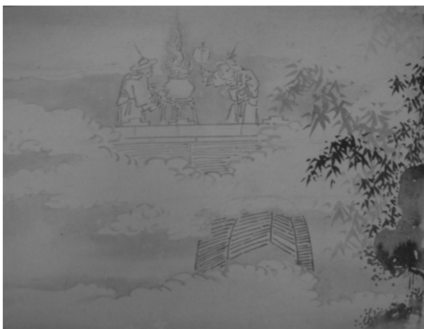
図3 《帝鑑図画稿断簡》部分 足利学校蔵

と比較し得る中世から近世初期における画題辞典である (41) 。そこにも烽火を扱った画題は看取できなかった。